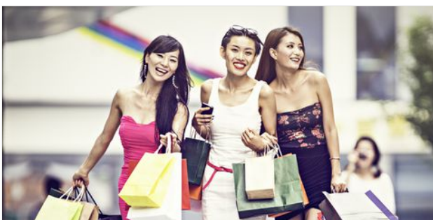
CÓMO APROVECHAR EL TURISMO DE COMPRAS