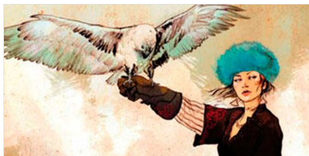
CÓMO CONSEGUIR UN CERTIFICADO DE CALIDAD