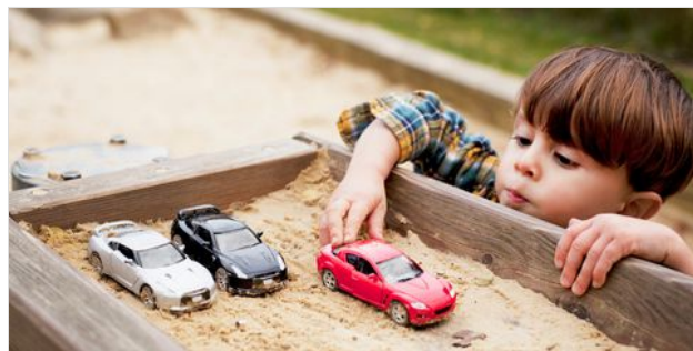
SANBOX: EL MVP LEGAL