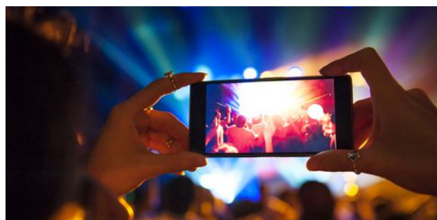
24 TENDENCIAS QUE TE VAN A DAR IDEAS DE NEGOCIO