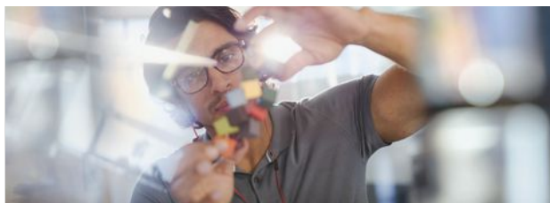
LA PRODUCTIVIDAD RENTABLE