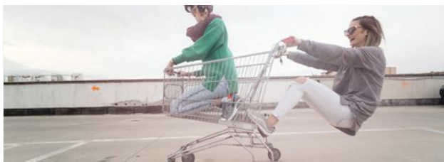
AUMENTA LA CONVERSIÓN ONLINE EN MODA