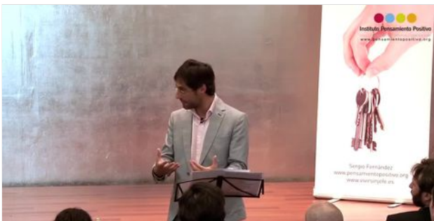
VISUALIZA LO QUE DESEAS Y LO CONSEGUIRÁS