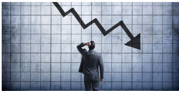
5 AVISOS DE QUE TU EMPRESA PODRÍA ESTAR EN DECLIVE