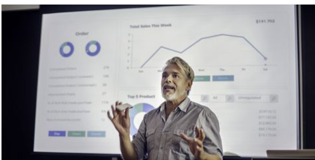
TRUCOS DE DISEÑO PARA ACERTAR CON TU PRESENTACIÓN